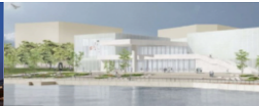
Shanghai en Chine

Sur une carte du monde situer les trois Centre Pompidou, comparer leurs architectures.